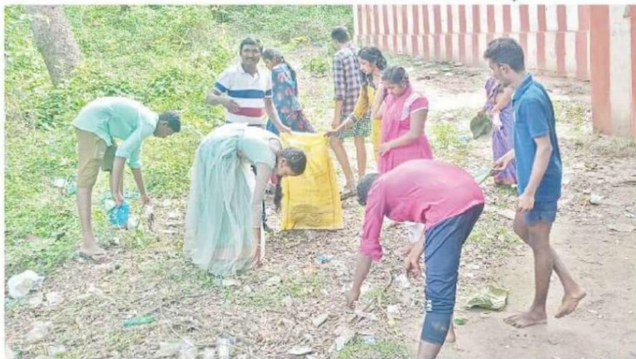
వ్యర్థాలను తొలగిస్తున్న విద్యార్థులు