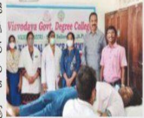
రక్తదానం చేస్తున్న విద్యార్థులు